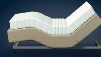
Pullman Express verstelbaar met RF afstandsbediening