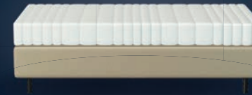
Pullman Express vlak